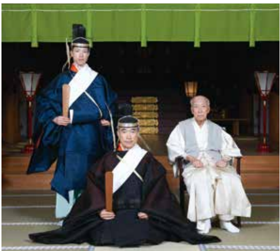
平成五年五月二十五日 神社本庁より多年に亘る功績に対し 長老の敬称と鳩杖を授かる